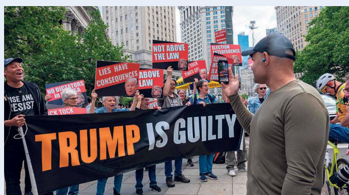
Demonstratie na de schuldigverklaring van Trump.